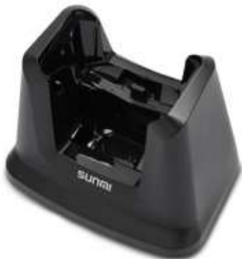
1 Зарядная станция для ТСД + UHF