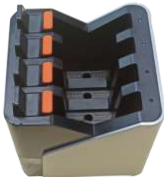
2 Станция зарядки для 4 АКБ