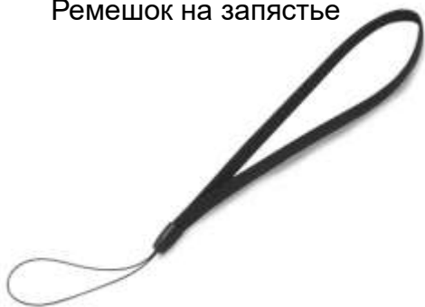
2 Ремешок на запястье