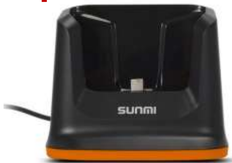
1 Зарядно-коммуникационная подставка