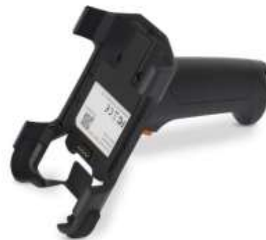
3 Пистолетная рукоятка